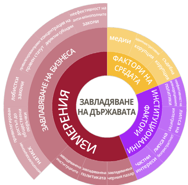
Модел на Диагностичната оценка на завладяването на държавата (Стоянов, А., Герганов, А. & Ялъмов, Т., 2019)

Докладът за състоянието на четирите държави анализира политически, пазарни, институционални и технически аспекти на завладяването на държавата и достъпа до информация в три икономически сектора - търговия на едро с твърди, течни и газообразни горива; търговия на едро с фармацевтични стоки; и строителство. Като следваща стъпка инициативата SCE MAPS ще приложи Диагностична оценка на завладяването на държавата . Тази оценка дефинира завладяването на държавата като институционализация на корупционните отношения, която води до приватизация на управлението, системно и постоянно предоставяне на частни стоки на похитителите (или приватизаторите) на правителствените