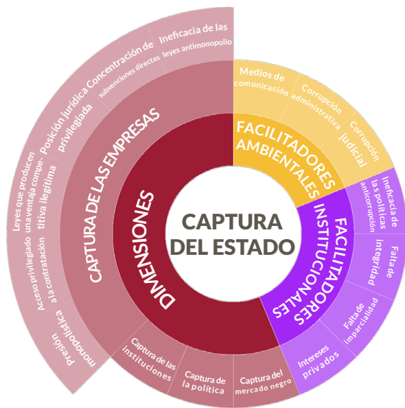
State Capture assessment diagnostics model (Stoyanov, A, A. Gerganov & T. Yalamov, 2019)

autoridades europeas podrán crear instrumentos para evaluar y hacer frente a estos fenómenos en sectores económicos con una fuerte regulación. Como punto de partida, el Mapping Report de SCEMAPS analiza, en estos cuatro países, los aspectos políticos, de mercado, institucionales y técnicos de los tres sectores económicos seleccionados: venta al por mayor de combustibles sólidos, líquidos y gaseosos; venta al por mayor de productos farmacéuticos; y construcción. En un siguiente paso, SCEMAPS promoverá la implementación de la metodología del State Capture Assessment Diagnostics (SCAD) . Esta describe la captura del Estado como la institucionalización de la corrupción, que conduce a una privatización virtual del poder público y un beneficio directo y sistemático de los actores 'captadores'. La captura del Estado también se define como el abuso de las normas de buena gobernanza en el proceso de redacción, aprobación y aplicación de leyes y marcos regulatorios en favor de un pequeño número de beneficiados. SCAD modela los intentos de abuso de empresas mediante indicadores a nivel nacional, que reflejan la presión de la monopolización y la ineficacia de las leyes antimonopolio.